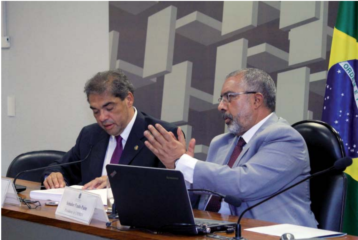
Senador Hélio José (PROS-DF), Relator da CPI da Previdência e Senador Paulo Paim (PT-RS), Presidente da CPI da Previdência